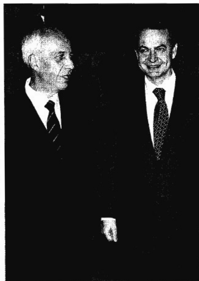
David Taguas (presidente de Seopan) y José Luis Rodríguez Zapatero.

De momento, el Gobierno ha rectificado de lo que el propio ministro de Fomento, José Blanco, consideró "recorte excesivo" y la semana pasada anunció que se salvarían 500 millones de euros de este ajuste, cifrado en 6.400 millones para 2010 y 2011. Esta cifra se traduce también en la conservación de 9.000 empleos. El 'tijeretazo', según la CEOE, podría in-