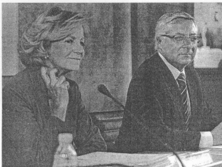
La vicepresidenta Salgado y Blanco, ministro de Fomento, ayer, en Economía, tras su reunión.

Las comunidades autónomas que registraron mayores aumentos fueron Extremadura, Asturias, Andalucía, la Comunidad Valenciana, Madrid, Castilla-La Mancha, el País Vasco y Aragón. Mientras que en Cantabria, Galicia, Cataluña y La Rioja bajaron.